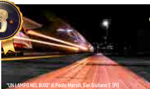
“UN LAMPO NEL BUIO” di Paolo Marsili, San Giuliano T. (PI)