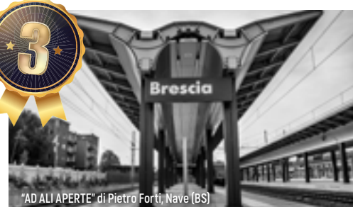
“AD ALI APERTE” di Pietro Forti, Nave (BS)