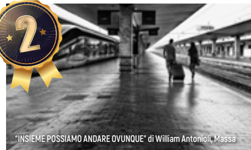
“INSIEME POSSIAMO ANDARE OVUNQUE” di William Antonioli, Massa